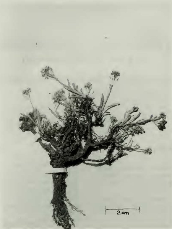
FIG. 1. Lepidium reichei . Teillier y Pauchard 2506. Parque Nacional El Morado (SGO).